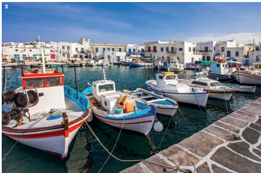
1 et 2. Le ravissant port de Naoussa avec ses maisons blanches cubiques, son église et ses bateaux de pêcheurs.

10 heures du matin il n'y a personne." "Après deux ans de travaux, nous avons emménagé. Notre style de vie a légèrement changé, car nous sommes à présent chez nous et pouvons vivre un peu en sauvages. À Paros, vous pouvez avoir des déjeuners et des dîners tous les jours. Nous préférons