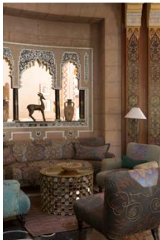
De gauche à droite : face à l'Atlas, le palais du peintre Claudio Bravo. Une chambre de la maison d'hôtes Dar Al Hossoun. Le Palais Oumensour, ancienne maison privée transformée en hôtel. L'un des patios du Palais Salam où le temps s'est arrêté. La Gazelle d'Or dont le raffinement attire toujours les personnalités.